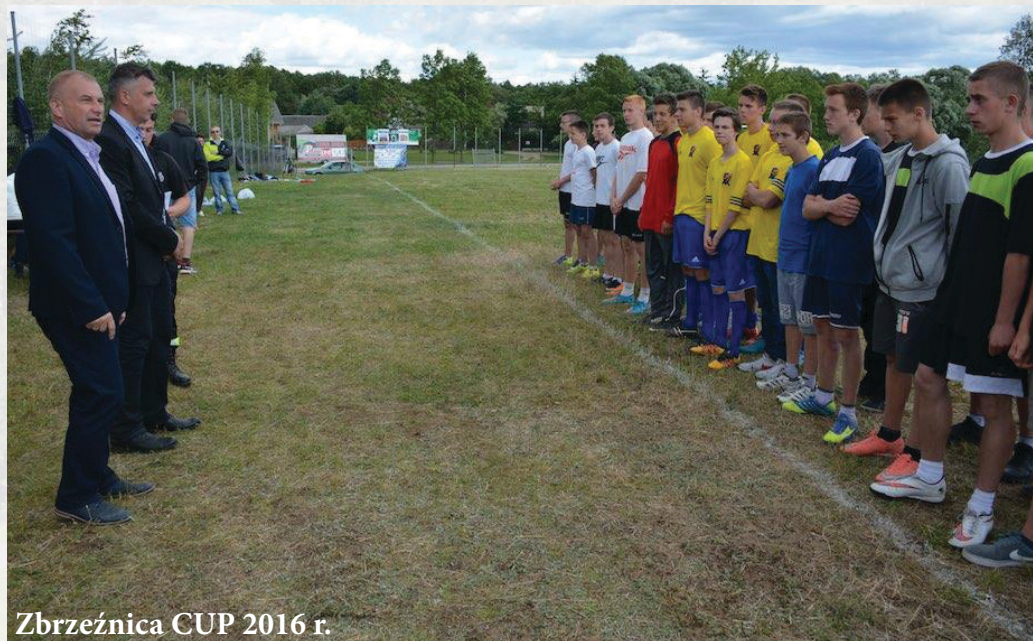
Zbrzeźnica CUP 2016 r.

Od ubiegłego roku jesteśmy organizatorem turnieju piłkarskiego młodzieży do lat 18 o Puchar Wójta Gminy Zambrów - „Zbrzeźnica CUP”. Ta forma rywalizacji jest doskonałą atrakcją dla młodzieżowych drużyn pożarniczych z terenu Gminy Zambrów.