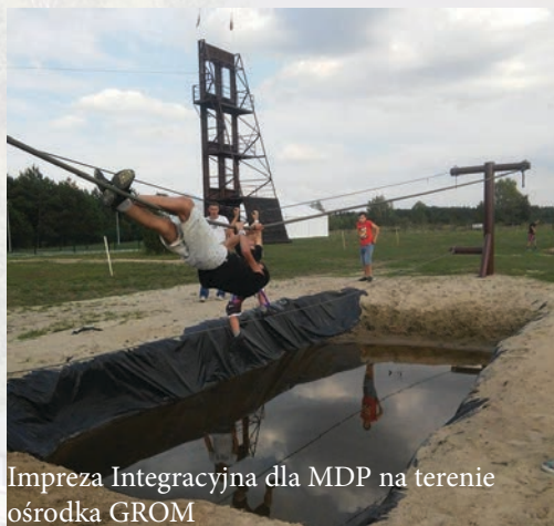
Impreza Integracyjna dla MDP na terenie ośrodka GROM

Więcej informacji o działalności naszej jednostki: www.facebook.com/ospzbrzeznica