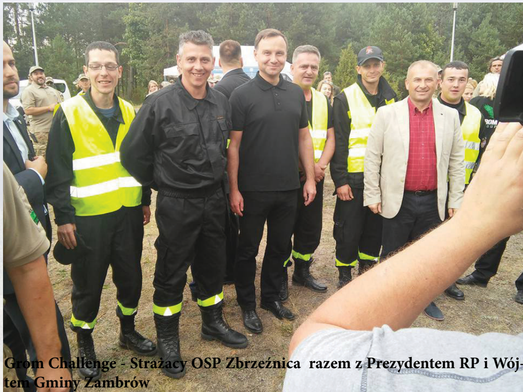
Grom Challenge - Strażacy OSP Zbrzeznica razem z Prezydentem RP i Wójtą Gminy Zambrów

Nasza straż ściśle współpracuje z Jednostką Szkolenia Poligonowego Grom Group , Fundacją Niezapomniani oraz Klubem Motocyklowym „Żubr” Zambrów.