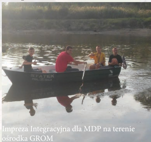
Impreza Integracyjna dla MDP na terenie ośrodka GROM