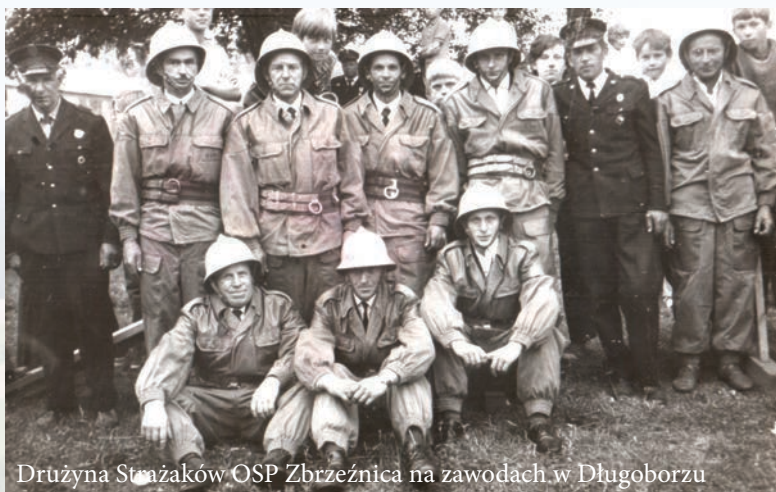
Drużyna Strażaków OSP Zbrzeźnica na zawodach w Długoborzu