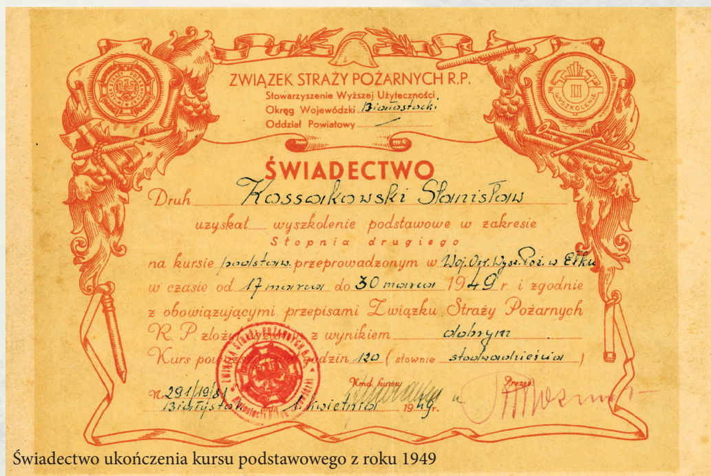
Świadectwo ukończenia kursu podstawowego z roku 1949