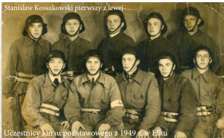
Uczestnicy kursu podstawowego z 1949 r. w Elku